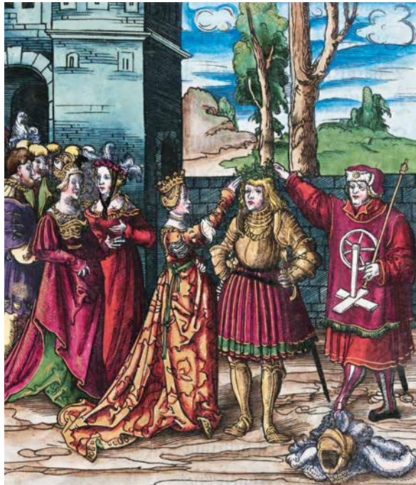
Maximilian, mit halblangem Blondhaar, wird von Maria von Burgund mit einem Lorbeerkrantz gekrönt. Darstellung im 'Teuerdank'