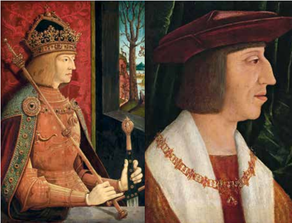
Bernhard Strigel, König Maximilian in goldenem Harnisch