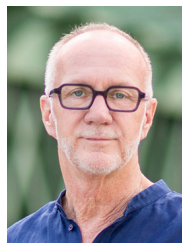
© Leonhard Hitzensauer / Paul Zsolnay Verlag

Moderation: Andrea Wieser (Tiroler Tageszeitung)