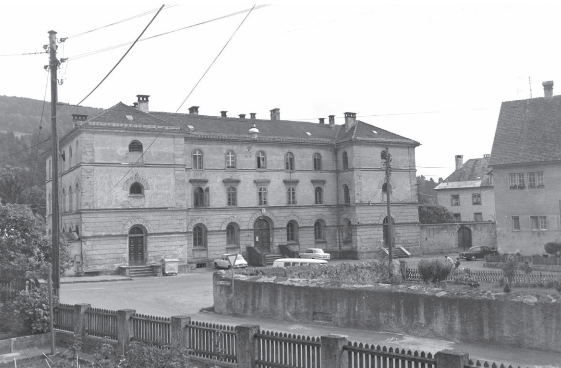
Das ehemalige Gefängnis in der Bregenzer Oberstadt. Foto 1971.

13 Bis Ende Januar 1945 verhielt ich mich unauffällig und arbeitete hart. Dann wurde ich ein zweites Mal verhaftet und ins Gefängnis nach Bregenz gebracht. Dort steckte man mich zusammen mit elf Gefangenen verschiedener Nationalität in eine kleine Zelle. Niemand nannte mir einen Grund für meine Verhaftung. Einmal pro Woche machte der Gefängnisdirektor mit einer Wache die Runde, um die Zellen nach Waffen oder spitzen Gegenständen zu durchsuchen. Bei einer dieser Inspektionen fragte er mich, weswegen ich einsäße. „Das weiß ich nicht“, antwortete ich. Er rief mich zu sich und ernannte mich zum Faci , einem der Häftlinge, die bei der Essensverteilung halfen. Ich hatte keine Ahnung, warum er mich ausgesucht hatte. Entweder näherte der Krieg sich dem Ende oder er betrachtete mich nicht als Verbrecher. Von da an bekam ich besseres Essen, dazu übriggebliebenes von den Wachen. Sie ließen mich tagsüber in den Hinterhof, und ich durfte sie in die Stadt begleiten und ihnen helfen, ihre Einkäufe zu tragen.