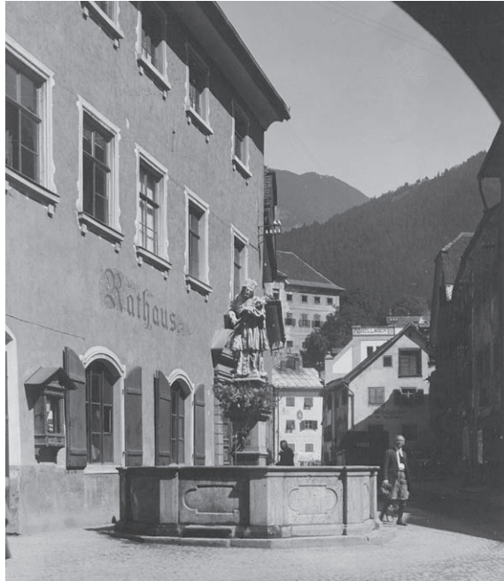
Das Alte Rathaus in Bludenz, wo die Stadtpolizei stationiert war. Möglicherweise ordinierte hier auch der Amtsarzt. Foto um 1935.