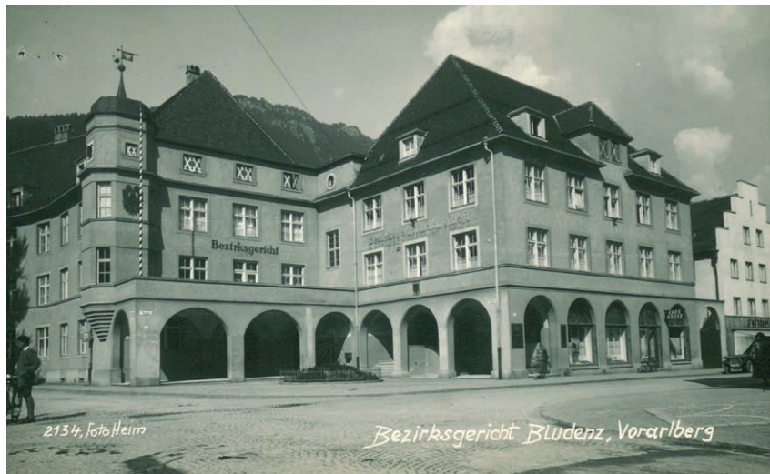
Das Bezirksgericht in Bludenz am heutigen Sparkassenplatz (während der NS-Zeit „Adolf-Hitler-Platz“). Das Gefängnis befand sich in diesem Gebäudekomplex. Foto vor 1942.